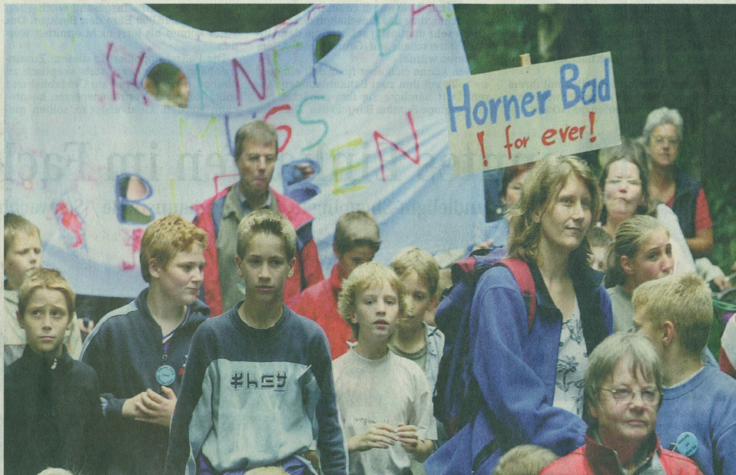
Mit Bannern und Plakaten kämpften die Bürger im Jahr 2003 für das Horner Bad, als es nach Plänen der großen Koalition geschlossen werden sollte. Die Protestaktionen, die Gründung einer Bürgerinitiative und die Aktivitäten von Bürgerverein und Beirat führten zur Rettung.

Der Aushub der Becken beginnt am 5. Dezember 1932. 50 Männer vom Freiwilligen Arbeitsdienst ziehen Tag für Tag mit Hacke und Schaufel hinaus zum Bahnhofswirt Wilhelm Hägermann. Dicht hinter dem Kleinbahnhof Horn, direkt an der Bahnstrecke nach Lilienthal, arbeiten sie, wühlen die Erde auf, schaffen auf Kipploren moorigen Lehm fort, bis sie auf weißen Sand und Kies stoßen.