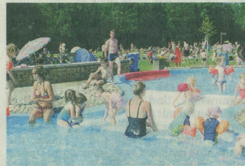
An schönen Sommertagen herrscht großer Andrang. In der diesjährigen Saison hatte das Horner Bad rund 73 000 Besucher.

Zurzeit werden die Umkleiden und Sanitäranlagen modernisiert und barrierefrei gestaltet. Außerdem wird die Raumaufteilung optimiert. „Zur nächsten Saison ist alles fertig und schick“, verspricht Lachmann. Schließungspläne seien kein Thema